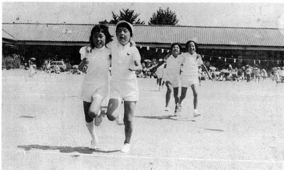
藤田小学校運動会