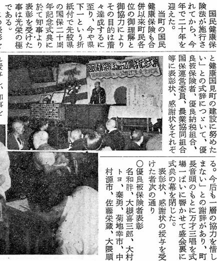
国民健康保険法施行20周年記念式典の様子