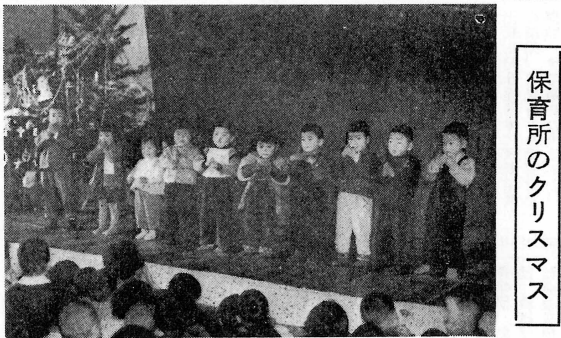
保育所のクリスマス

(一) 新参者の心を失 いつまでも新参者の心を失わまい。新入社員がよくわからぬ様子です。まじり、知らぬふりなまじり。きどらぬ。だれに何を教へておらぬ。だれに何を教へておらぬ。だれに何を教へておらぬ。 (二) 選挙を喧嘩とおもふな 選挙を喧嘩とおもふな。選挙を喧嘩とおもふな。選挙を喧嘩とおもふな。選挙を喧嘩とおもふな。 (三) 自分の世界を狭く 自分の世界を狭く。自分の世界を狭く。自分の世界を狭く。自分の世界を狭く。自分の世界を狭く。 (四) 自分で考える 自分で考える。自分で考える。自分で考える。自分で考える。自分で考える。