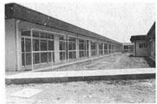
老人居室 (北側より撮影)

入所対象者は、六十五才以上の者であつて、身体上もしくは精神上、または環境上の理由及び経済