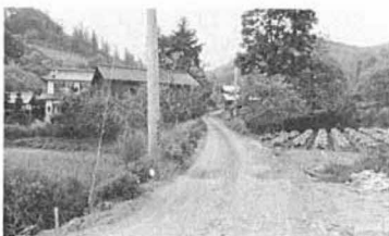
舗装されることになった町道高寺線

去る五月二十二日、第三回国見町議会臨時会が開かれました。提出議案の町道舗装工事について賛