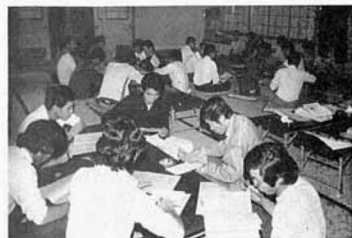
(各委員会に分かれて)

会員の年齢は、おおむね二十三四歳ぐらいから三十五歳ぐらいまで、ある程度経営的にも責任のある人々を対象としています。専業兼業の区別なく、農業に対する意欲があれば会員となることができ