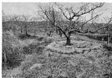
(西大枝の二重隍跡)

阿津賀志山麓で鎌倉幕府側と奥州平泉、藤原氏がその存亡をかけて一大決戦をしたことは、多くの人々によく知られているところであり、江戸時代、松尾芭蕉が「伊達の大木戸をさす」と記したあたりがその地域である。 藤原氏側は、ここに二重隍を山の中腹より阿武隈川まで造り、源頼朝軍を防ごうとした。しかし二重隍の遺構がよく残されているのは山麓が中心となっているので、ここ以外はあまり知られていない。現在、明確にするところできるのは大木戸地区(土居の山)と西大枝地区(字石田、字二重遺構などである西大枝地区の字石田の二重隍遺構は、高さ約一・五メートル、幅が約十メートル、長さ七・八十メ