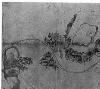
観月公園の溜井と藤田城跡(元禄8年)

国見町の史跡の中で、二重障跡が古代の東北に別れをける記念物であるとすれば、藤田城跡は、東北において南北朝の争乱に終止符をうつ決定的な記念物であるといえよう。二重障を破つて進んだ源頼朝は鎌倉時代を開き、また藤田城の落城(貞和二年、興和)により東北の南北朝の争乱は足利尊氏方によつて室町時代の歴史が有利に展開されていつた。その証拠に、落城後、足利尊氏方の武将吉良貞家は伊達郡内の南朝方の諸城を攻め落し、福島県内はもちろぬ東北各地の南朝方の諸城に攻撃を加ふるのである。以上のように藤田城はさして大規模とも思はれないに歴史的に重要な意義を持つものである。