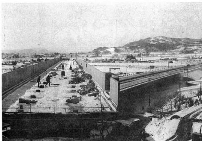
蔵王トンネル入口から高架橋をのぞむ 右は高速道路