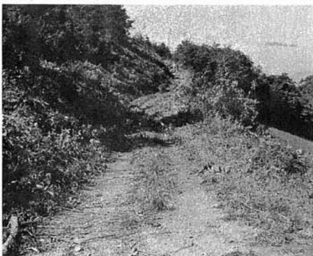
ここに小畑線林道が開設される