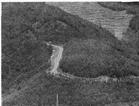
工事が進む鳥取線林道

一方、鳥取線林道工事は昨年度新しく採択され、小畑線とともに公共事業の一般林道開設事業として着手されました。これは宮城県白石市小原字百貫山を起点として鳥取・内谷の林地を横断、石母田字二道路越地内で、県道赤井畑国見線に接続、連絡道としての性格をも持つ幹線的林道として開設されるものです。計画延長四千メートル、幅員四メートル、利用区域は一三五ヘクタールを有しています。この林道が完成された晩には森林資源の開発、育林、拡大造林