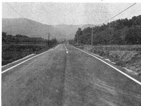
舗装の完成した貝田—光明寺間

今までの砂利道から見違えるように整備され、現在は大枝地区の方を改良中です。やがて全面舗装になるのもそう遠いことではないでしょう。