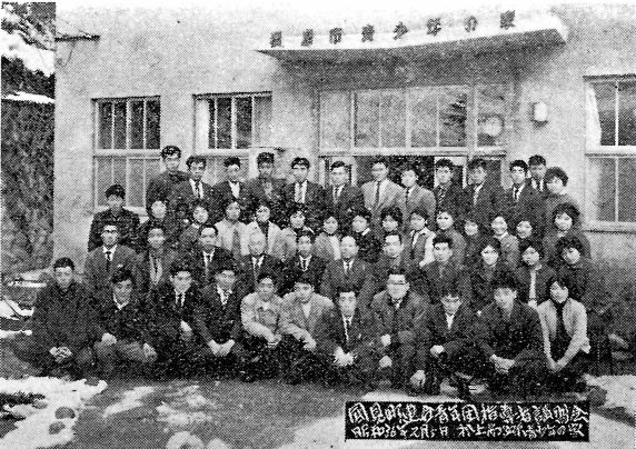
（編者曰く）「国見町役場厚生課で、保健婦たちが懇切に