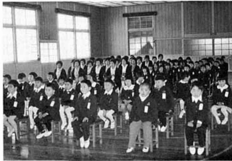
▲昨年の森江野小入学式

タンポポ 北風が吹かない日だまりにひっそりと咲くタンポポ。あざやかな黄色の花はいかにも明るい春光を象徴しているかのようです。キク科の多年生草本でどこへ行っても見かけられる草花で、他にいろいろな名前があって、時の花、天気の時計、天気の花などと呼ばれたりもしたようです。英語ではダンダライオン、フランス語ではダン・ド・リオンとって、いずれも「ライオンの歯」という意味。