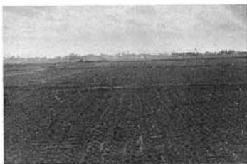
▲整備された徳江地区

区（桑折地内）佐久間川より東側（国見寄り）一〇〇ヘクタールについて実施設計がなされております。年々、夏施行と併せながら工期の短縮をはかり、一年でも早くこの事業を完了し、農家の経営の合理化と経済の安定をはかって参りたいと、役職員は一丸となって取り組みんでおります。みなさんのご協力をお願い申し上げます。