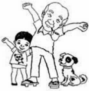
(七ヶ歳で世界にわたった人)