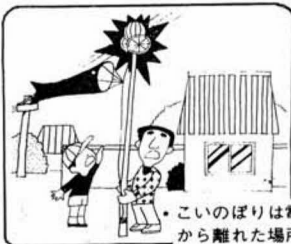
こいのぼりは電線 から離れた場所へ