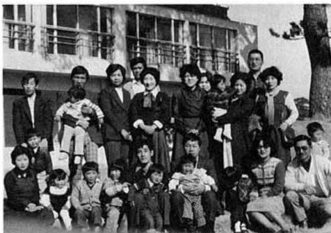
新婚学級もいつのまにか 子どもがいっぱい