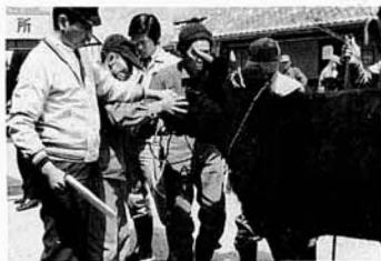
いづれ劣らぬ牛ばかり

顔つきも、また、よい牛の条件のひとつ、品のある牛の肉はうまいのことです。飼育者の皆さんの苦勞が実りつりつばに成長した牛は、今年中には希望の子牛が産まれることでしょう。