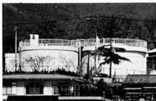
ひときわ目立つ貯水池

これから夏にかけて水の需要もグンとアップしますが、余裕もつて供給できるものと期待されています。ただし、節水にはご協力をお願いします。