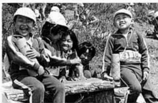
藤田小3年のよい子たち

なお、山をいつもきれいにしておくために、ごみ持ち帰り運動を実施中です。ご協力ください。