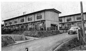
簡保融資施設（大坂住宅）

サイズは、カライスライド35ミリ以上、白黒は四ツ切り、募集期間は六月三十日まで。なお、くわしくは郵便局窓口でたずねてください。