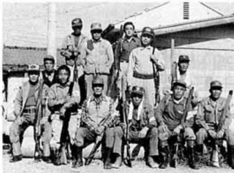
(▲駆除隊のみなさん)

町では以前から町内の猟友会員に依頼して、農産物に被害を与える有害鳥獣の駆除を行っております。ことしも、4月から10月まで予定しています。