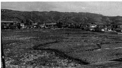
写真は現在の宮前地区

道路は幅員六・四メートルのものが延長一二七〇メートル整備されます。この外、地区内取付道として一三〇メートルが計画されています。電気、水道、ガスも完備され、この事業の完成後は耕谷団地に次いで一大住宅区域となります。12月の完成が待たれます。