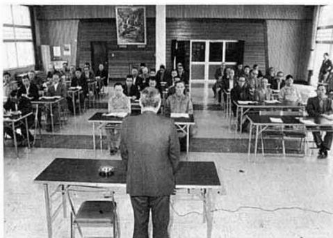
熱心に聞く学級生 (4.27.開校日)