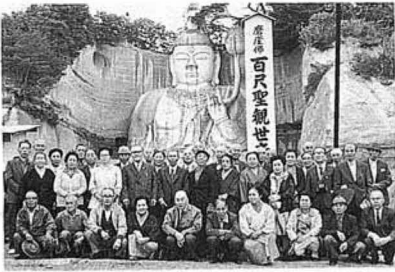
個人が3代にわたって彫り続けているという百尺観音 (相馬)