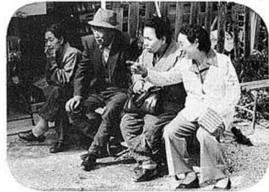
楽しそうに何を話しているのかな (中村城)