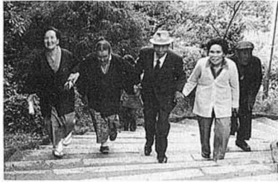
きつい階段もらくらくに (霊山神社)

参加者 151人、3台のバスに分乗し、霊山神社、霊山子どもの村、山津見神社 (飯沼村)、百尺観音 (相馬)、松川浦 (昼食)、相馬港、最後に中村城を見学、新緑の山と、海の幸を満喫してきました。