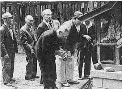
ここを拜めば足が病まないという (中村城)