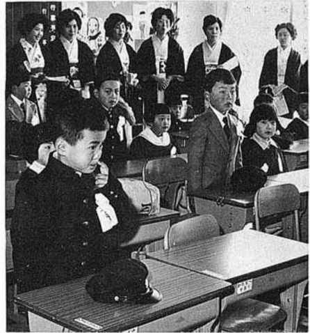
新一年生(大木戸小学校にて)

次に、高校卒業者の進学率は、昭和五十二年で全国平均三三・二パーセント、県平均二四・四パーセントです。当町は昭和四十八年