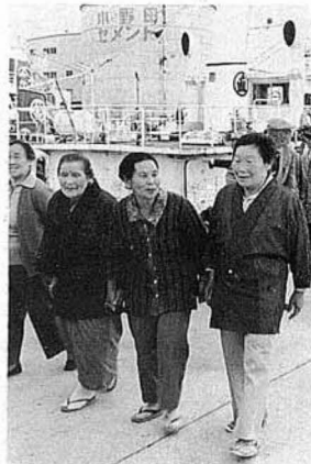
「相馬港もすいぶん、大きくなっただんだい」