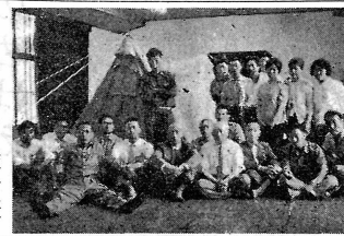
【写真】は野外活動のリーダー養成講習会の様子

公民館では、スポーツ振興法の趣旨にのっとり、青少年の野外活動をすすめるため、キャンプ講習会を開く。講習会は、野外活動のリーダー養成を目的とし、野外活動のリーダー養成講習会を開く。講習会は、野外活動のリーダー養成を目的とし、野外活動のリーダー養成講習会を開く。