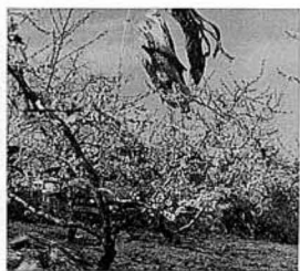
ももの花の景観はすばらしい

・老人や子どもをいたわり、希望をもたせましょう。 ・なごやかで平和な、明るい家庭をつくりましょう。 一 楽しく働いて、豊かな町をつくりましょう。