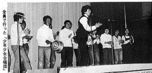
全員で行った「少年少女合唱団」