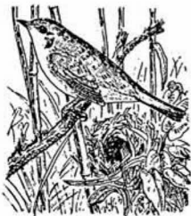
春佐鳥ともいわれるウグイス

一 教育と文化を高め、希望にみちた町をつくりましょう。 ・未来を拓く、若い力をそだてましょう。 ・教育を高め、文化財や伝統を守りましょう。 ・教養を深め、郷土に役立つ人になりましょう。