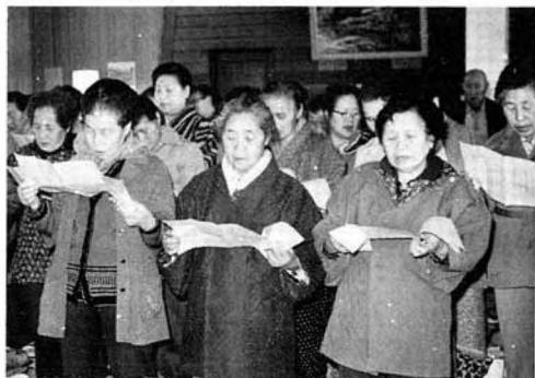
▲明治学級の歌を練習する学級生