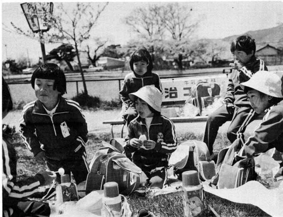
▲森江野小の1・2年生の遠足(観月台公園で)