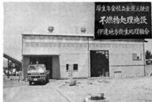
工事費 4,500万円のうち、4,250万円が厚生年金還元融資