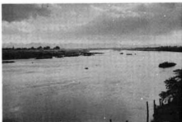
阿武隈川も大層きれいな川になったといわれているが……

このような水質悪化を防ぐため、国（環境庁）では先ごろ「富栄養化対策」の一つとして、リンを含む合成洗剤の使用を自粛し、