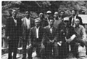
全員集合、あれ、足りないナ

五月二十二日、夜来の雨は降りやまなかったが、天気予報での午後からは「晴」とのこと、気を強くして公民館前に集まったのがいつもの勉強仲間の十五名。午前七時、マイクロバスで出発。国見ICより高速道入り線は雨もやみ明進、県境を越える頃には雨もやみ明るい曇り空に変わる。西那須川木戸も美しい温泉街を通り抜けて峠の登り口にある名所の「逆杉」