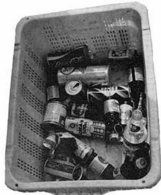
燃えないごみの専用容器です