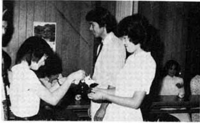
いつか本物の日が……

八月二十九日、模擬結婚式、私は新婦の役をさせていただき、形式的なことも随分勉強になりましたが、それ以上に結婚の意義について考えさせられた日でした。「相手のどこに惹(ひ)かれましたか」という質問に対して「優