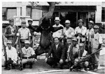
あえなくタウンしたクマ