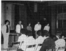
新役員そろう青年学級

町内に在住し、働きながら気軽に学習する場として、青年学級が、五月七日に開講いたしました。毎週一回木曜日に、レクリエーション、講義、話し合い、野外活動と幅広い学習内容で展開いたします。尚入級希望の方は、参加してみませんか。