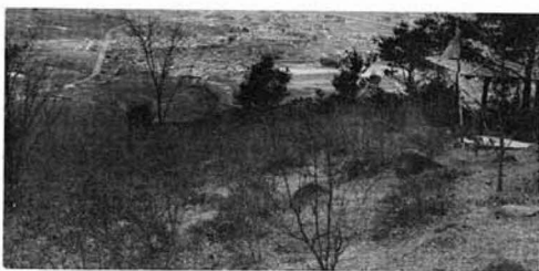
きれいになった山頂広場