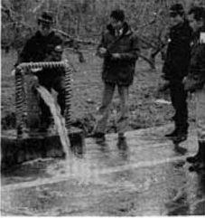
消火栓の点検作業

●火気使用には火の用心とともに換気の用心もお忘れなく。時々部屋の換気をして、酸欠事故や一酸化炭素中毒事故を防ぎましょう。 ●年末年始は酒を飲む機会が多くなります。「酒を飲んだら車を運転しない」はドライバ―が守る最小限のモラルです。飲酒運転を徹底追放しましょう。道路が凍結する季節です。スピードを落とし、車間距離を長くとりましょう。急ブレーキ、急ハンドルも危険です。「安全はあなた自身がつくるもの」