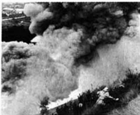
黒煙の中、必死の消防隊員

七月十五日朝、東北自動車下り車線の阿津賀志山ろく大木戸地内で、トレーラーのマグネシウムが発火、爆発した。化学消防車も手が付けられず、六時間以上も燃え続け、翌朝も再び黒煙をあげるなど危険な事故だった。昼間の交通量が少ない時間帯だったのが大惨事をかろうじて避けさせたといえる。