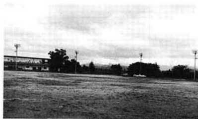
県北中の屋外照明

学校施設開放夜間照明施設として、県北中学校の屋外運動場照明設備が八月二十日に完成します。この設備は、照明灯四基からなり、照度はソフトボール用となっています。利用者はつぎの要領により公民館に申込んでください。