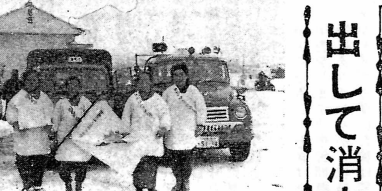
町内の各万部婦人会はこれまで「婦人消防協力会」として、それなりに活動して、風呂場をはじめ火の用心に努めて「出して消す」より「出さぬが」が、これに協力して、指定された「一層火の用心運動」を徹底することになった。

一年間に九六名減つたわけである。この傾向は当分続き、藤田以外の小学校は各学年一学級編成ということになる。