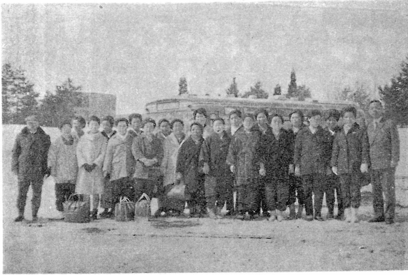
びつくりづくしの研修会