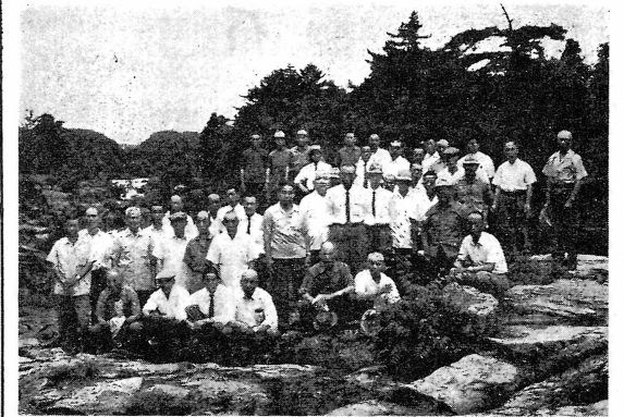
あつて鎌倉文化の先駆をなした貴重な資料となっていることとは皆様よくご存じの所であらう。一行は午後三時又も車