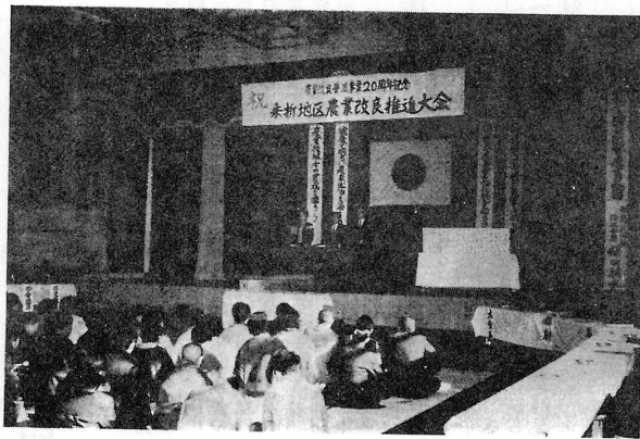
農業改良普及事業20周年記念

昭和二十三年八月農業改良助長法が制定され協同農業改良普及事業が発足してから二十二年を迎えた。この間、農業をとりまく社会経済などの情勢は激しい変化を示し、農業者はもろもろ農業関係指導者のなみならぬ努力と苦闘の積み重ねによりわが国の食糧事情の好転と日本経済の驚異的な発展をとげたのである。 しかしながら、これからの農業を考えると、その進路はまことにきびしく、前途多難なるものがある。このときに功勞のあつた推進員ならびに関係者に対しそれぞれ表彰の意気を高揚すべく、旧暦十二月二十三日、町立藤田小学校体育館においてわが町をはじめ桑折梁川三町の農業(生活)改良推進員、農研グループ、農協などの関係者三〇〇名の参集を得て、農業改良普及事業二十年記念桑折地区農業改良推進大会が催された。 大会はまず主催者の挨拶のあと普及事業二十年のあゆ