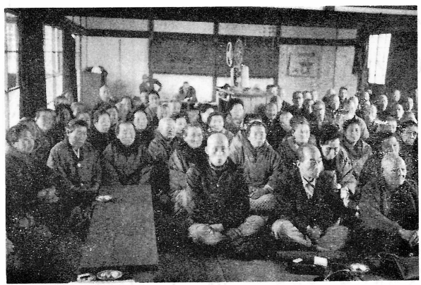
明治学級だより 42人が精勤賞.....