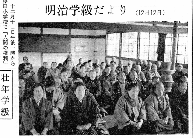
十二月十二日午後一時から藤田小学校で「人間の権利」について学習しました。町の

だれもおとすものもな、便器と舟とをまくる元において、一日中だまっていて、老人の姿を、思い浮かべただけでも胸が痛くなるではないか。明治、大正、昭和の三代を社会でつくってきた老人への代償が、悲惨なことではないだろうか。いかりがこみこんでいると考えられる。 老人の傷病は長期のものが多い、かつ症状が固定的になり、かつ重症化しやすいものが多い。老人が医師にも見てもらいたいと思つても、