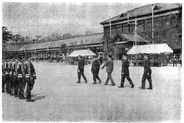
春季点検 (通常点検)

(町の人口) 昭和45年5月1日現在 世帯数 2,549戸 人口 { 男 5,788人 女 6,267人 計 12,055人