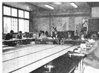
▲活発な意見を出し合う委員のみなさん