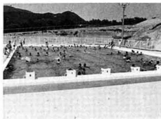
▲にぎわった町民プール（昨年）