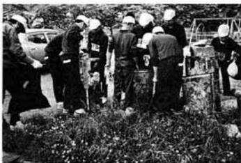
▲こんなにゴミが集まりました

県北中学校では、五月三十一日、富良野県北クリーンキャンペーンを実施し、全校生で町内