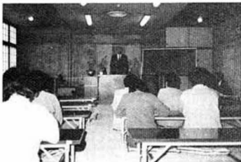
▲蓬田教育長の講話を聞く学級生のみなさん