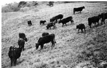
▲新緑の中、草をはむ牛たち

この日放牧された牛は、町内三十戸の農家から放牧される六十五頭のうちの二十九頭です。牛たちは、十月中旬まで、広い牧場のんびりとヤマでの生活を楽しむこととなります。