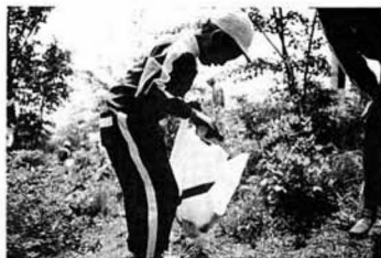
▲空きカンはずもう捨てないで!!

前日までの雨もあがり、さわやかな五月晴れに恵まれた五月二十一日、大木戸小学校では、恒例となった阿津賀志山ハイキ