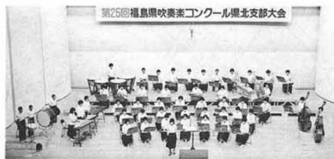
▲金賞となった県北中吹奏楽部（県北支部大会から）

▽この広報く に みに対して、意見・要望などがありましたら、意のままにお寄せいただきたいと思います。また、トピックなどがあるようお願ひします。(佐)