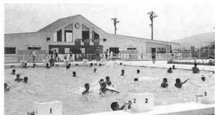
▲にぎわった町民プール