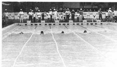
▲激しいデッドヒート (女子100m平泳ぎ)