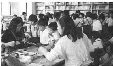
▲今日も大にぎわい (藤田小学校で)

去る八月二十五日、第二回目の母と子の公民館活動運営委員会を開催し、第二学期(九月、十二月)の活動計画を策定しました。いろいろな創作活動を実施しながら、読書活動を進めて参りたいと思います。