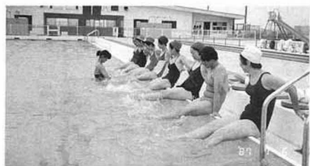
▲レディーススイミング教室

六月二十一日から開設しておりました町民プールも、八月三十一日をもって終了しました。七十二日間の開催中、利用者数は、昨年並の延べ一万五千七十六人の町民の皆さんにご利用いただきました。