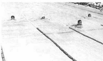
▲負けるもんか!! (男子100m平泳ぎ)