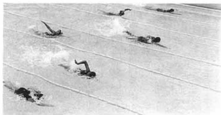
▲好勝負を展開 (女子25m自由形)