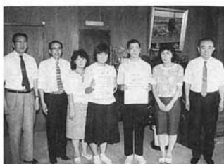
▲賞状を手に記念撮影

第二十五回県吹奏楽コンクールが八月二十九日、福島市の県文化センターで開催し、中学校の二部で、県北中学校が「金賞」