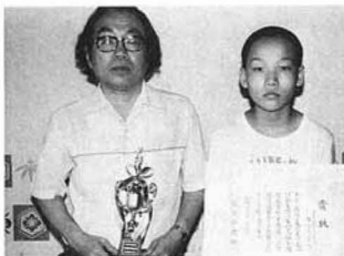
▲古小高君(右)と石原さん