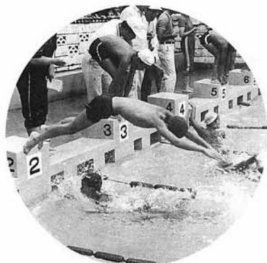
▲それっ たのむぞ!! (男子100mリレー)

あいにくの小雨模様の中でしたが、大会新記録が十二個、大会タイ記録が一個など、好記録が続出しました。 水しぶきをあげながら、元気いっぱい泳ぐ子供たちをカメラでおいかけました。