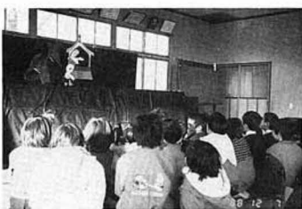
▲人形劇「三枚のお札」に見入る子どもたち

今回の人形劇で広がった輪と和をステップにして、新しい時代「平成」の子ども達のためにますます頑張りたいと思っています。