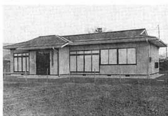
▲森山第四部落多目的集会所

と、県内で最も早い昭和二十五年以来一貫して、中学生の剣道指導にあたってきました。この間に千二百名を超える青少年を指導、各種大会で数々の優秀な成績を残し、青少年に自信と意欲を培ってきました。県内の先駆者でもあり、長い間の努力と功績が認められ、今回の受賞となったものです。