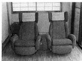
▲設置されたローラーウエーブ

これは財団法人自治総合センターが宝くじの益金を財源として、地域の健全な発展を図り、