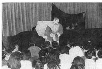
▲サンタクロースに子どもたちは大よろこび

この日のために練習を重ねてきた子どもたちは、かわい衣装に身を包み、歌や遊戯、リズム劇「七ツ星」などを次々と披露しました。会場につめかたは多くのお父さん、お母さんたちは写真を撮ったり、拍手をしたり、わが子の熱演に見入っていました。