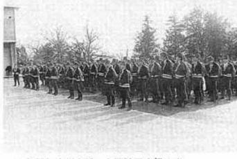
▲年間無火災を誓った消防団出初め式

町消防団の出初め式が、一月四日午前十一時から福祉センター前で行われ、団員の皆さんは一年間の無火災実現を誓い合いました。