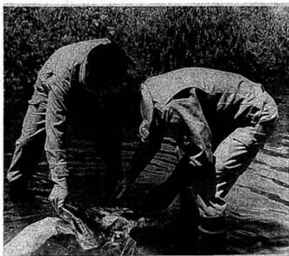
▲牛沢川 (西大枝字築館)