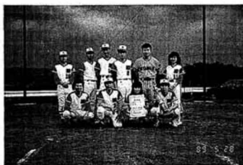
▲優勝した陸商会チーム

▽準決勝 国見電子7―0藤田郵便局 陸商会6―2町役場B ▽決勝 陸商会6―5国見電子