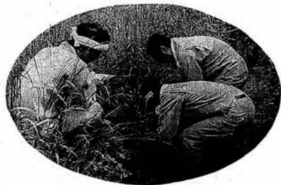
▲竜護院川 (藤田字中沢)