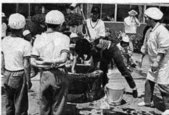
▲はじめのもちつきを楽しむブラジル農業研修生

する風習を、身をもって体験しようとしたものです。昨年収穫したモチ米約二十七キロ、キネとウスを使ったつきな粉とゴマもちに調理され、早速、全員で会食しました。