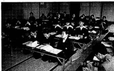
▲ジュニアリーダー教室開講式

青少年育成事業として中学生を対象とした「ジュニアリーダー教室」が、このたび開講しました。これは、学校教育、家庭教育で習得できない部分の社会教育を、野外活動やレクリエーション、スポーツなどの活動とおして必要な知識や技術を習得するとともに、社会や地域に貢献できるリーダーの養成を目的としています。