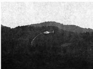
▲ヘリコプターによる薬剤散布

九一三 仙台ホリビル 晴無線従事者国家試験センター 一(☎〇三二二二一四一) 四六 間伐で健全な山づくり 補助制度の活用を 間伐の運搬は、雪折れ、病害虫発生の原因となります。町では、間伐促進のため補助制度を設けており、その活用してください。