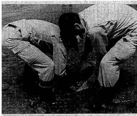
▲滝川・阿武隈川合流点 (川内)