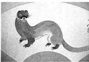
▲石原さんが出品した「いちち」

これは韓国文化芸術研究会が「外国の優れた文化芸術を韓国に紹介し、三ヶ国間相互の国際文化交流をはかり、理解と親善を深める」ことを目的に開催し