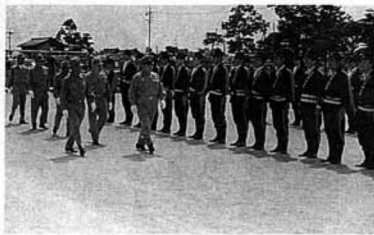
▲きびきびと行われた定期点検

の消防施設、設備は年々充実されて、これらの維持管理には万全を期し、有事の際には十分な効果が得られるように」と訓示がありました。