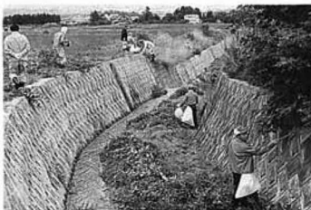
▲どんだんきれいに!