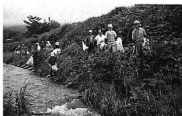
▲大勢の参加をいただきました

れた空き缶、廃ビニール、廃材、紙屑などのゴミの回収や雑木伐採、草刈りを行いました。また、ゴミの搬出には、町内の建設業者の皆さんの積極的な応援をいただきました。