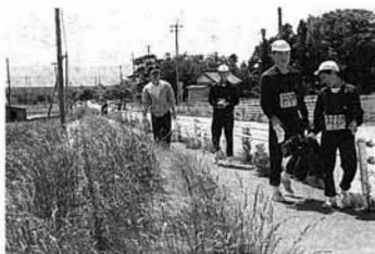
▲県北中クリーンキャンペーン