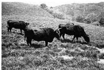
▲のんびり草をはむ牛たち