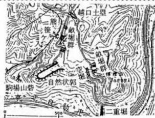
厚樫山南麓畝堀群分布図

最近、厚樫(国見)山周辺の 掘(筋)遺構の調査を行い、石 母田の熊笹ヶ入・国見山上地内 の三か所で、新たに畝状堅堀群 ?が発見されており、東北地方 では報告されていないので、その概 要について紹介をしておくこと にする。