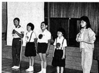
▲表彰された4人の子どもたち