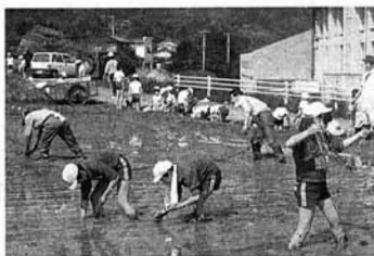
▲なかなかむずかしいなあ