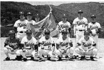
▲優勝した貝田チーム