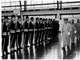
▲町長の点検を受ける団員の皆さん

午前九時に藤田市街地に整列した団員を視閲。その後、藤田小体育館で通常点検、規律訓練が行われ、消防団員のきびきびした行動で、火の守りの誓いを新たにしました。