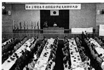
▲県消防協伊達支部幹部大会

第四十二回福島県消防協会伊達支部幹部大会は六月十四日、国見町民体育館で開かれ、伊達七町の副部長以上の消防団幹部をはじめ、各町町長、町議会議長など来賓を含め約三百五十人が出席しました。