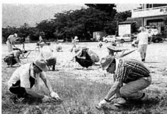
▲成人学級の奉仕作業

今年度の公民館活動の努力事項のひとつにボランティア活動の推進を設定し、各学級の計画の中で積極的に取り上げることになりました。