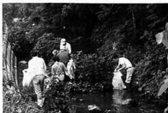
▲大勢の参加をいただきました(牛沢川)