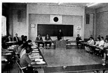
▲暴力団排除を誓った設立総会

国見、桑折両町の飲食店、旅館など五十八の事業所が、「桑折地区暴力団排除推進連絡会」を結成し七月二日、桑折警察署で総会を開催、発足しました。