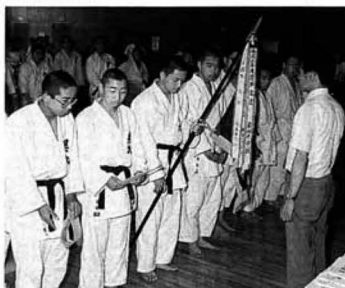
▲念願の初優勝を果たした県北中柔道部（団体の部）

松陽中武道場で行われた柔道は、各校とも持てる力を十分に発揮し、好試合を展開。順調に勝ち進んだ県北中は決勝戦で霊山中と対戦、見事優勝しました。