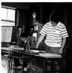
▲厳正に行われた抽選会

分譲にあたり、申し込みされた方にアンケートをお願いし、集約したところ、分譲地を新聞折込チラシ及び親類の紹介で知った方が約6割に、申し込みの理由としては家族の出身地及び交通の利便性、分譲地周辺の環境を挙げた方が約7割に達しました。町に対しては、環境及び恵まれた立地条件を生かして、今後また宅地分譲を推進して欲しい旨の要望が多数寄せられました。