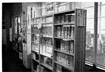
▲店内に設けられた「あつかし文庫」

習してきた劇や遊戯をお父さんや、お母さんに披露し、楽しいひとときを過ごしました。