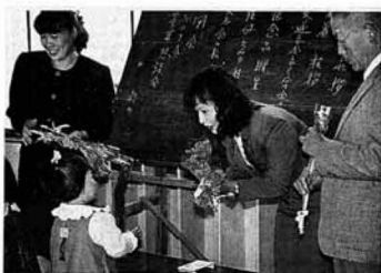
▲子どもたちから先生へ花束の贈呈

町内各季節保育所の閉所式が十一月三十日行われ、今年四月から元氣よく通っていた子どもたちにとって、ちょっぴり寂しい友達とお別れになりました。大枝季節保育所では、お世話になった先生に、子どもたち一人ひとりが花束を贈り涙ぐむ場面も。式のあとにはおゆうぎ会が行われ、今まで一生懸命に練