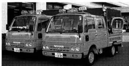
▲交付された2台の消防ポンプ積載車

第二分団第二部(石母田地区)と第三分団第三部(塚野目地区)に消防ポンプ積載車が納車されるにあたり十一月十三日、二十五日にそれぞれ役場前で交付式が行われました。