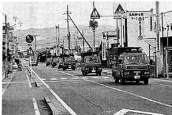
▲防火パレードで火災予防を呼び掛ける

「毎日が火の元警報 発令中」をスローガンとした秋の全国火災予防運動期間中の十一月十三日、町消防団では、これから一年のうちで最も火災の多い季節をむかえるため、防火パレードを実施しました。