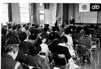
▲熱心に聴講している学級生