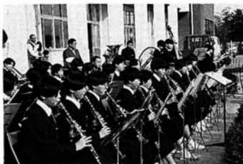
▲大会に花を添えた県北中 brass band