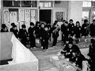
▲一年間ありがとう (大枝小学校)

「おぼちゃん、お兄ちゃん、三年間とても楽しかったです。たのきさんの本を読んだし、折り紙もおぼえたり、どうもありがとうございました」と、心を込めて書いた手紙やかわいい小物などをたくさんいただきました。