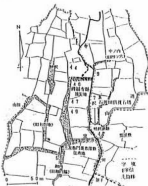
石母田供養石塔周辺地籍集成図

鎌倉時代の中期、徳治三年(一一〇七)当時高名な元の僧化僧である一山一寧に、僧知詮が頼り、これを碑面に刻した石母田供養塔(国史跡)がある。石塔は県境山嶺大峠山に源を発する溪流蛭沢川沿いの、石母田中ノ内(旧字名四ツ穴)地内に位置する。