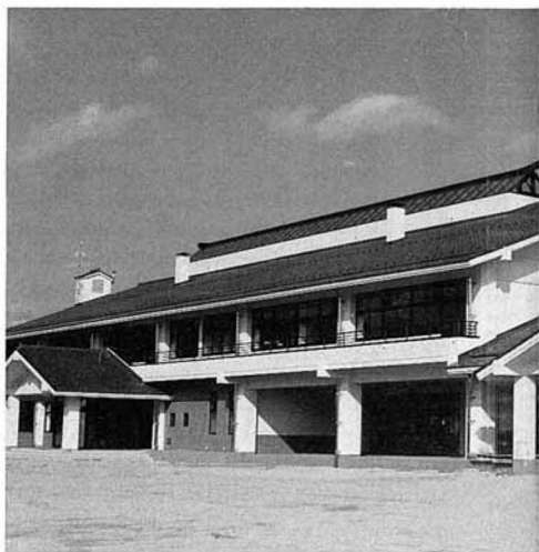
▲新 校 舎