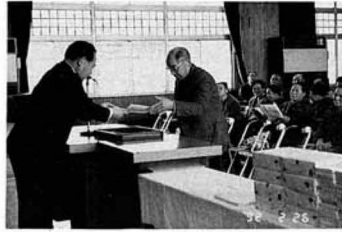
▲町長から交通安全大学修了証の授与