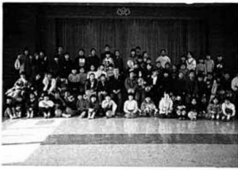
▲少年仲間づくり教室修了生

式では、春日公民館長の挨拶の後、全員に修了証書が渡されたほか七名に皆勤賞が贈られました。