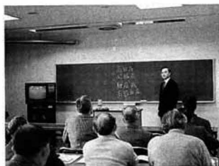
▲講義「成人病について」を受講

町保健課が主催する「宿泊健康教室」は二月二十七、二十八日の両日、福島市黒岩の県青少年会館で行われました。