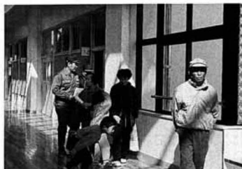
▲ピッカピカだ（一般公開・2月28日）

3月23日に卒業式を控えた6年生は「1か月と短い期間ですが、新しい校舎で勉強できて、とても良い思い出になります」と、完成を喜んでいました。