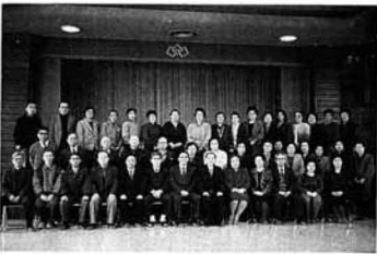
▲成人学級閉講記念写真

今年度は十四回の全体学習会を実施しましたが、初めて趣味のグループ学習(社交ダンス、ちぎり絵、書道)を取り入れたこともあり、昨年度以上の入級生があつて、多数の方が受講され、今年度の三つの努力事項を