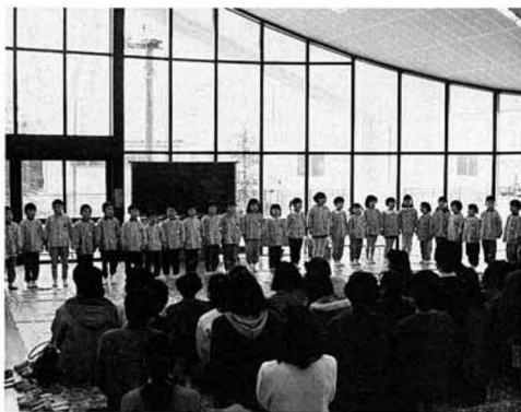
▲幼稚園遊戯室（お別れ会・3月6日）