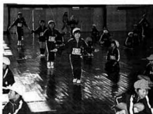
▲藤田小なわとび大会

藤田小学校の「校内なわとび大会」は二月十八日から三日間行われ、体育や休み時間に一生懸命に練習した成果を競い合いました。