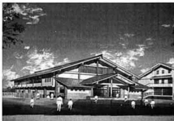
▲森江野小学校体育館完成予想図

積六百六十平方メートル。ステージのほか更衣室、放送室などが設けられ、今年十二月末完成を目指します。