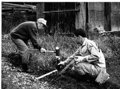
▲長狭物のくい打ち