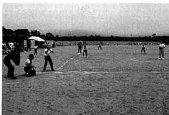
▲各試合とも熱戦を展開