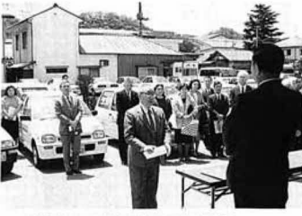
▲謝辞を述べる現地善作町社協副会長

五月十二日、福島県共同募金会から、ホームヘルパー事業推進のため軽自動車一台の交付があり、国見町社会福祉協議会をはじめ県内二十町町の社会福祉協議会に配車されました。