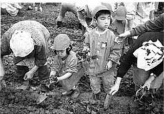
▲おばあちゃんと一緒に苗を植える子どもたち

藤田保育所の子どもたちが五月二十八日、桑折町の養護老人ホーム「桑折緑風園」を訪れ、お年寄りと一緒にサツマイモの苗を植え、交流を深めました。