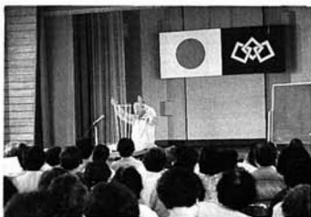
▲アサガオの育て方について学ぶ

わたしたちの町が、本年度厚生省より「高齢者の生きがいと健康づくり推進モデル市町村」に指定されたことに伴い、阿津賀志学級では、学級生全員の体験学習をとおして環境美化に努め、豊かな情操を養うというねらいで、アサガオのひとり鉢運動に取り組むことになりました。