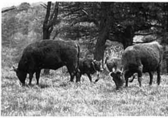
▲のんびり草をはむ牛たち

青々とした牧草が茂った町営牧場で五月十三日、放牧が始まり、冬の間、各飼育農家の牛舎で過ごした牛たちが、広々とした緑のじゆうたんのの上を元氣いっぱい駆け回っていました。