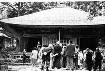
▲高蔵寺住職の説明を聞く阿津賀志学級生の皆さん(36)

また、同じく国の重要文化財になっている本尊の阿弥陀如来坐像は、約二・七メートルで、現在はほとんど漆黒色でしたが、天井につかえるばかりの透し彫りの飛雲光背を合わせると、全高五・一八メートルもあるそうです。お顔は眉目が切れ長く豊麗で、そのお姿に接し自然に手を合わせ