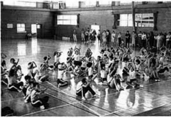
▲ゲームを楽しむ教室生

平成四年度少年仲間づくり教室の開講式が、六月十四日児童八十二名のほか父兄約六十名が出席して行われました。この教室は、小学校の高学年の児童を対象とし、学校や学年の異なる集団の中で、仲間づくりに必要な基本的能力を身につけ、心身ともに健全な少年を育成することを目的に実施するものです。