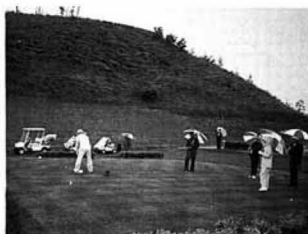
▲雨のなが行われた町民ゴルフ大会