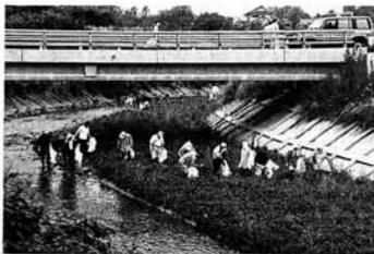
▲大勢の参加をいただきました

河川クリーンアップ作戦は、七月五日、全町一斉に行われ、各地区の皆さん約二千八百人が参加し、町内を流れる滝川・牛沢川・普蔵川をはじめ各河川とその支流で清掃作業をし