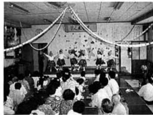
▲子どもたちの熱演にお年寄りも大喜び

に練習を重ねてきた子供たちのかわいらしい劇や遊戯に、お年寄りの皆さんは大喜び、一つひとつの演技に大きな拍手を送っていました。