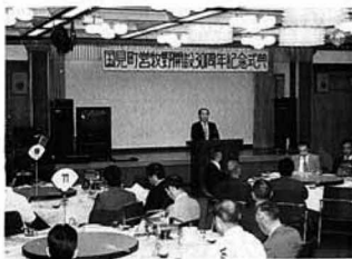
▲牧野開設30周年を祝った式典