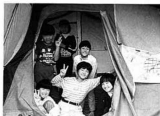
▲少年仲間づくり教室キャンプ(昨年)

月一回の学校週五日制が実施される学校は、全国の国立の幼稚園、小学校、中学校、高等学校、盲・ろう養護学校です。また、私立の学校にもできるだけ歩調をあわせるよう協力が求められています。