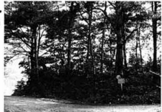
▲阿津賀志山越口土塁

古代末期わが国における政治の中心地であった京都あるいは鎌倉と、陸奥国の国府である多賀城や奥州藤原氏の平泉館を結ぶ、官道の東山道は藤田宿から伊達と刈田の郡境にまたがる、貝田と越河の地狭部を北に向かっていた。寿永四年(一一八五)、宿敵平氏を長門国の壇ノ浦に亡ぼした源頼朝は、文治五年(一一八九)の八月、東北の地に掌握し独自の政権を樹立し支配し