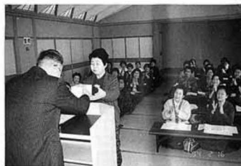
▲くく女性教室閉講式

昨年五月に開講以来、十四回の学習会と十一回のグループ活動を終え、去る二月十六日に閉講式を行いました。