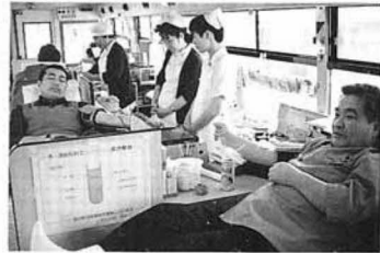
献血に協力していただいた皆さん

☆平成五年度採血状況 合計 九〇八本 達成率 一〇七・二% 四〇〇ml献血者 93人 成分献血者 91人