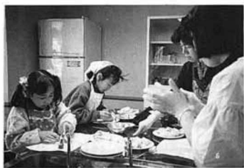
▲親子で楽しながらクッキング

二月六日と三月六日の二回にわたり、十二組の親子が出席して和やかな雰囲気の中で行われました。藤田在住の杉