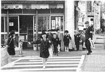
元気に登校する児童たち (平成5年4月)

この運動の目的は、県民一 人一人に交通安全知識を普及 し、交通安全思想の高揚を図 るとともに、正しい交通ルー ルの遵守と交通マナーの実践 を習慣づけることにより、交 通事故防止の徹底を図ること です。