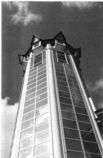
大空にそびえる観月台文化センターシンボルタワー

国見町は、町村合併促進法による県内のモデルとして、昭和二十九年三月三十一日、県下に先がけ、藤田町、小坂村、森江野村、大木戸村、大枝村の一町四カ村が、対等合併し、国見山、国見峠などの地名をとり、国見町が誕生しました。 新町国見町の誕生以来、本年は満四十年の節目の年です。