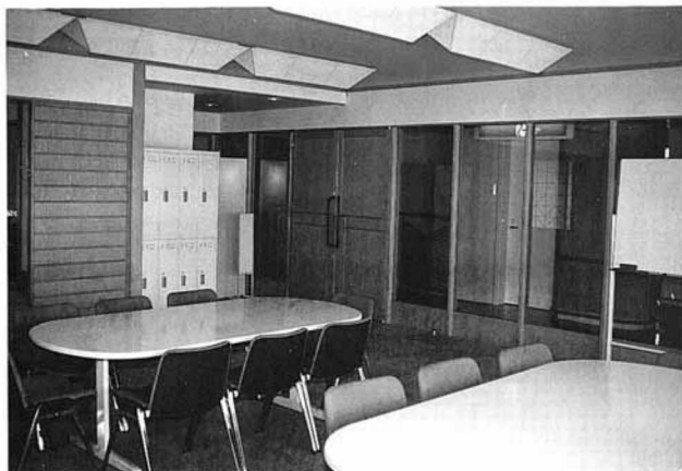
デイサービスルームは観月台文化センターの2階にあります エレベーターを降りて左手の日当たりの良い部屋です

平成六年度より開始するデイサービス事業は、ホームヘルパー派遣事業、シヨートステイ事業と共に、高齢者在宅福祉サービスの三本柱といわれるものです。 平成五年四月に策定した「国見町老人保健福祉計画」に基づき行われるもので、伊達郡で初めて取り組む事業です。