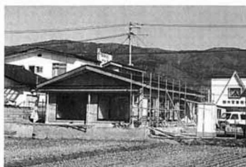
間もなく完成する藤田駐在所

なお、現在の藤田駐在所は、移転後解体され、敷地は役場駐車場として利用される予定です。