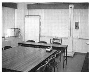
健康チェックを行う健康相談室