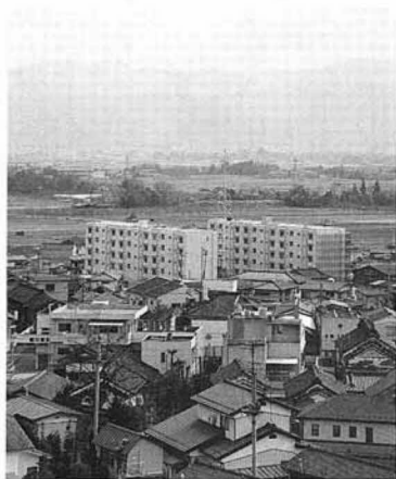
完成間近の雇用促進住宅「クニミ宿舎」 役場より福島方面へ国道に沿って徒歩5分

雇用促進住宅「クニミ宿舎」(愛称 サン・コーポラス クニミ)は、勤労者のために雇用促進事業団が建設し、管理する鉄筋五階建、3DK(2棟60戸)で、バス・トイレ付の近代的なアパートです。 現在、住宅にお困りの方で、次の条件にあてはまる方に入居をおすすめします。 ○同居する親族のある方。(配偶者、六親等以内の血族、三親等以内の姻族) ○確実な連帯保証人(原則と家賃・共益費・敷金等 ○雇用保険の被保険者であつて、適当な住宅が確保でき