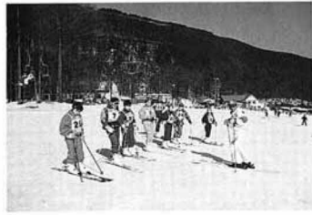
▲快晴に恵まれた親子スキー教室

スキー教室にはカラフルなスキーウェアを身につけた二十二人の親子が参加。スキーは初めてという人もおり、町