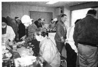
男性もクッキングに参加

右エ門会長）の皆さんが、二月二十四日、観月台文化センター栄養指導室において、男性にも簡単に作れる料理を習いました。