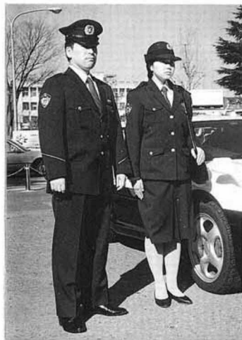
新制服 (右上腕部にエンブレム)

二十一世紀の新時代にふさわしい品位と伝統を保持し、さわやかでスマートな、そして力強く、皆さんに親しまれる制服にかわります。