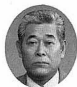
八島 博正議員 （当選5回）