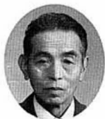
斎藤 隆議員 (当選3回)