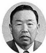
赤坂 浅吉議員 (当選5回)