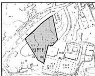
建設予定地(着色部)