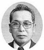
村上 利夫議員 （当選3回）