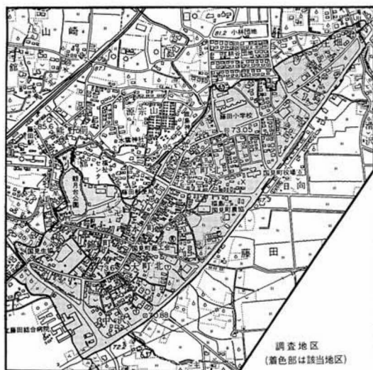
調査地区(着色部は該当地区)