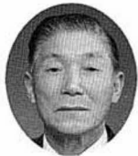
仲野 周一議員 (当選7回)