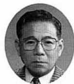
鈴木 光議員 （当選1回）