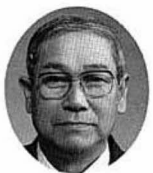
高橋 豊壽議員 （当選1回）