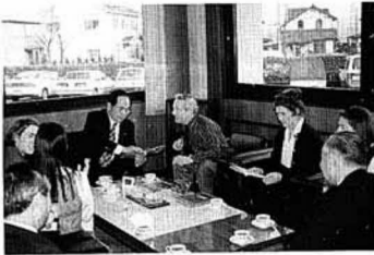
町長と歓談（町長室で）

富永町長は町の紹介を兼ねて町の歴史や特産品について説明し、また、「若人の翼」ヨーロッパ派遣団の団長としてイギリスを訪問した際の思い出やエピソードを披露し、歓談しました。夕方に催された歓迎会では、