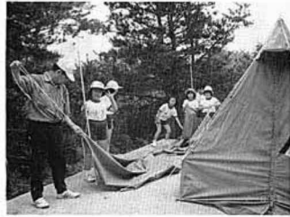
▲テント設置を行う仲間づくり教室生

この教室は小学四年生以上を対象に、学校や学年を超えた仲間づくりをしながら、人と人とのふれあいを大切にするにことにより児童の健全育成を目指すの