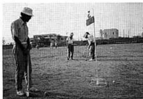
グラウンド・ゴルフの練習

夏季大会に併せて行われるデモンストレーション行事は、グラウンド・ゴルフ、少年剣道、トボール、インディアカの四競技に十一チームが参加します。