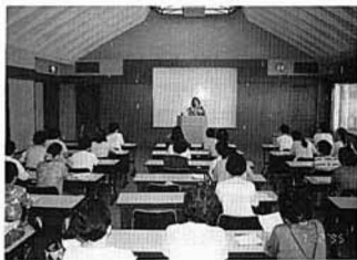
▲コレステロールについて講義を受けた女性教室

二日目は、自分たちでおにぎりを作って、近くの「水芭蕉の森」へハイキングに出かけました。