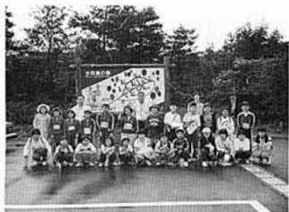
▲2日目は「水芭蕉の森」へハイキング