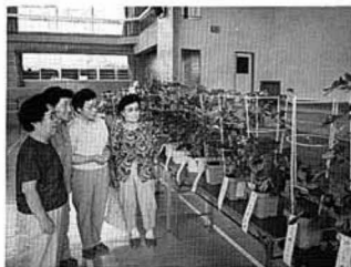
▲アサガオに見入る学級生の皆さん

観賞会には学級生が丹精込めて育て上げた約五十点が展示され、会場は色とりどりの花をつけた朝顔が美しく咲き誇り、華やいた雰囲気になりました。