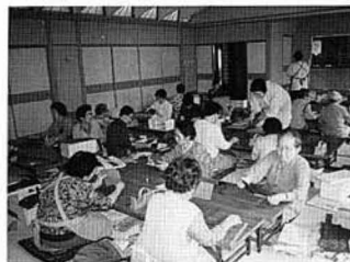
▲和紙工芸に取り組む阿津賀志学級生