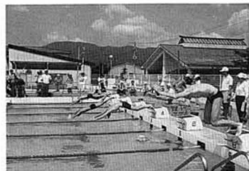
小学生と一緒に競泳です