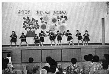
園児の発表に拍手

この交歓会は今年で十二回目。この日、招待された地区の高齢者はおよそ百名。園児たちの発表が終わることに、大きな拍手