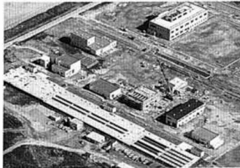
建設が進む浄化センター

排水設備は、みなさんが維持管理することになりますので、粗悪な工事や違法な工事がなされないよう、町で指定した排水設備指定工事店とみなさんの契約によって工事を行っていただくこととなります。