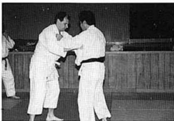
ダンスじゃない。柔道です。