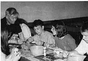
こけしづくりに挑戦