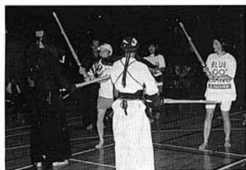
力いっぱいたたいていいんですか?