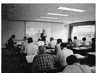
▲歴史について理解を深めた成人学級

そして、郷土の歴史を探り知る事は、我々の世代のみで絶やす事なく、次の世代や時代へと受け継がれてこそ意義があり、郷土の歴史として更に価値の高いものになるであろうと結ばれ大変有意義な学習会でした。