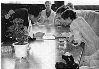
地図をひろげて「ドイツのどのあたりなの?」