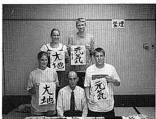
花マルいっぱいもらいました。^^^