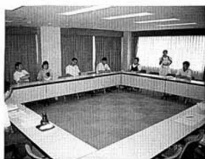
家庭での父親の役割を考えた子育て教室