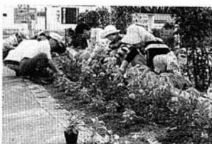
朝早くからご苦労さまでした

大枝地区と大木戸地区のそれ 大木の果樹研究会が、桃の品評 会を開き、今年の桃の品質を競 いました。 各賞の受賞者は次のとおり。