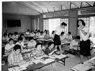
電気について学んだくみにみ女性教室