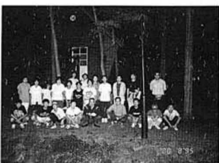
交流を深めたキャンプの参加者

ジュニア仲間づくり教室、県北中学校一、二年生十八名が参加したジュニア仲間づくり教室のキャンプ活動は八月二十日、二十一日の両日、宮城県七ヶ宿町の南蔵王青少年旅行村で行われました。