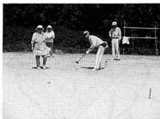
スティックさばきも鮮やかに