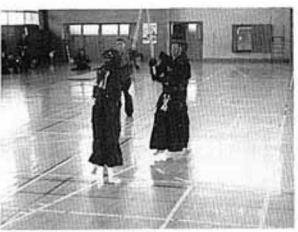
各試合とも熱戦を展開 (観月台文化センター体育館)