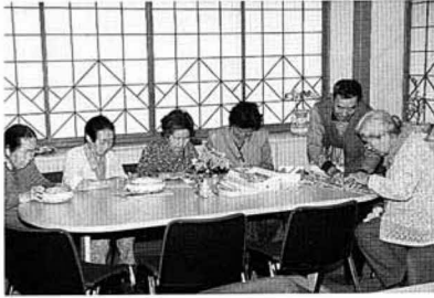
デイサービスセンターでのひとじり

国見町では、乳幼児から高齢者まで、安心して暮らせるよう福祉と健康のまちな施策を展開しています。九月十五日から二十二日は老人保健福祉週間。平成五年度に策定された国見町老人保健福祉計画に基づいた国見町の老人福祉施策を紹介します。