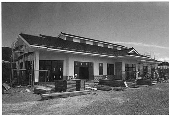
▲名前が決まった 国見町大木戸ふれあいセンター

このセンターは七月末に完成し、八月下旬から、大木戸季節保育所が始められるとともに、一般の方々の使用もできると予定です。