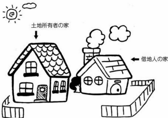
申告のときに、地積割合を明確にしましょう。