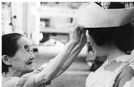
(第12回シルバーフォトコンテスト金賞作品)