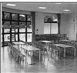
世代交代ルーム (季節保育所)

べ、完成を祝いました。 この施設は自治省が指定するふるさとづくり事業として建設が進められてきました。これまでに、森江野地区には国見町森江野町民センター、大枝地区には国見東部高齢者等活性化センター、藤田地区には藤田地区文化センターが完成しています。 今回、大木戸ふれあいセンターが完成したことで、旧町村単位ごとに中央集会所の建設を目指してきた町としては、小坂地区の中央集会所の建設を残すのみとなりました。