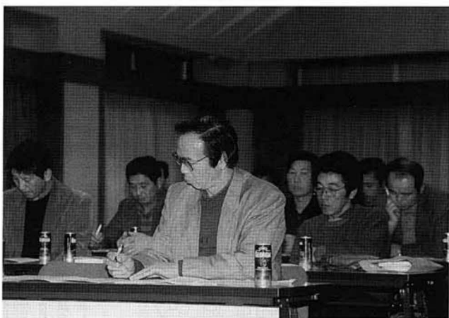
==== 認定農業者 農政懇談会 ====

一月二十七日、観月台文化センターで、認定農業者の農政懇談会が開かれました。 この農政懇談会は、国見町の農業を担う立場にある認定農業者が町の農業行政への意見を述べたり、交換しあうものです。 国見町の認定農業者は三十九人、みんな熱心に農業に取り組んでいる人たちです。