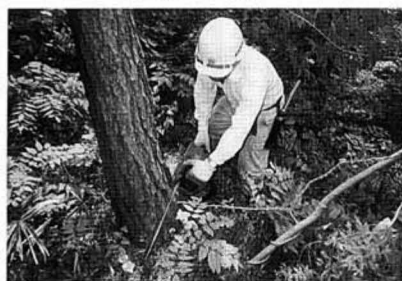
(伐倒作業・大木戸)

松くい虫の被害を防ぐために 国見町では、春と秋の二回、松 くい虫防除を行っています。マ ツノザイセンチュウをつけた松 くい虫が枯れた松から飛び立っ 前に行う春駆除では、被害木を 切り倒したり（伐倒駆除）、町 内二か所で航空防除（薬剤の空 中散布）や地上散布を行っています。