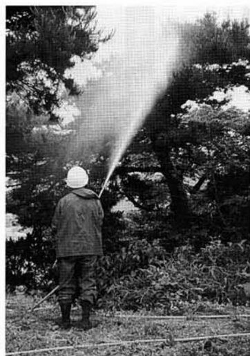
(地上散布・石母田)