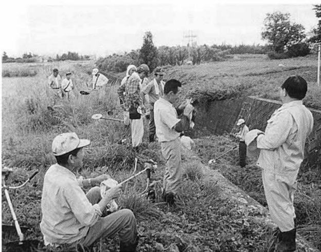
7月6日に行われたクリーンアップ作戦には、約3000人が参加しました

小坂地区のほ場整備に合わせ、共同減歩方式により、約七畝の非農用地を確保することにしてあり、このうちの約五畝は小坂地区の農家の次男、三男の方の住宅用地に、残りの約二畝には小坂地区の中央集会所を建設する予定です。中央集会所の建設は、農村総合整備モデル事業で実施します。着工は、ほ場整備の換地処分手続きが完了した後となる見込みです。