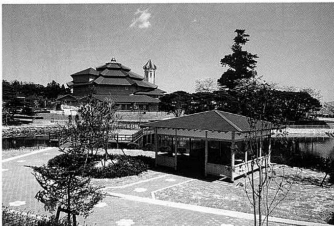
町の文化ゾーン・観月台公園と観月台文化センターには子どもからお年寄りまで、たくさんの人々が集います。

でしょうか。これらの整備がある程度完了するまでは、スポーツゾーンの山野台運動公園や保健福祉、文化、研修施設を兼ね備えた観月台文化センターを大いに利用してください。