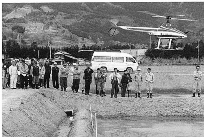
2回目の取り組みとなった水稲直播栽培は、泉田地区のほ場整備後の水田で行われました。各地の農業関係者の関心を集め、たくさんの視察団が訪れました。