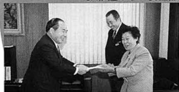
▼JA伊達みらい女性部