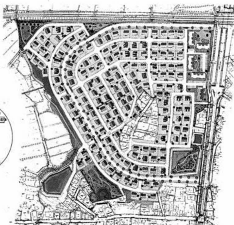
板橋南住宅団地の分譲区画数は163区画。自然と調和した緑たっぷりの公園や公営住宅50戸も建設されます。