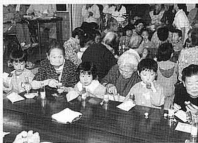
おいしいね サツマイモ

町営牧野の開牧式が10月20日行われ、牛たちも牧場から我が家へ向かいました。今年は55頭の牛が、山でのびのび過ごし、鶏牛の9割が受胎したとのこと。