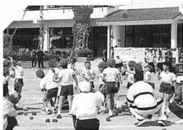
10月3日大校小運動会 強風のため一時中断も、風にも負けず元気な競技が繰り広げられました。