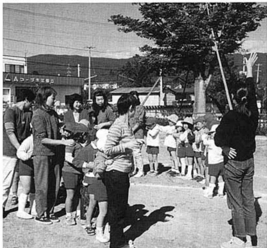
おかあさん先生の指導のもと、ゲームを楽しむ森江野幼稚園の子どもたち