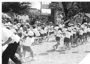
10月2日藤田幼稚園 秋ばれのもと、中央のおやつをめぐって餅引きです。

藤田保育所の園児たちは、10月21日養折緑風園のおじいちゃん、おばあちゃんと、サツマイモを掘り、収穫を楽しみました。掘り起こしたサツマイモは、さっそく蒸され、みんなで秋の実りを味わいました。