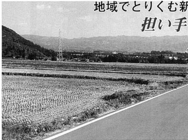
面整備も終盤となる小坂地区は場整備事業