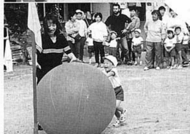
10月8日藤田保育所 身長より大きい大玉を転がす遊べ。