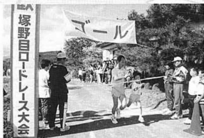
塚野目ロードレース

町の代表的な秋祭り鹿島神社の例大祭が、十月十九・二十日行われ、藤田商店街を露天下のしめぎ、多くの人で賑わいました。御輿や四台のやたい(山車)が激しくぶつかる夜、まつりも最高潮をむかえ、御輿が参道を駆け上がり、お宮入りとなりました。