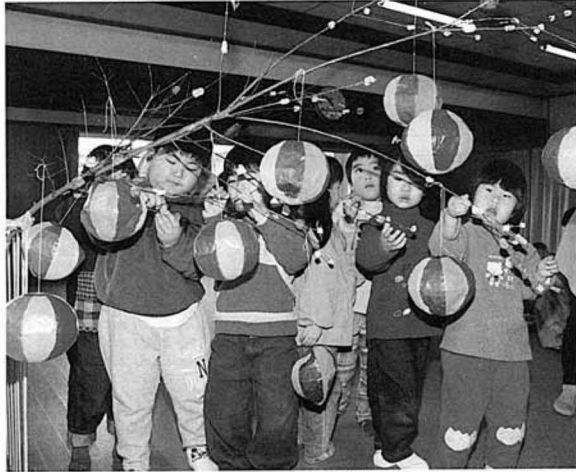
だんごさしをする園児たち

子供たちは、画用紙に骨を合わせ、足をつけただけのものですが、飛ぶりに挑戦しました。さつそく飛ばしてみますが、なかなかうまくはいかない様子です。それでも懸命に取り組む姿