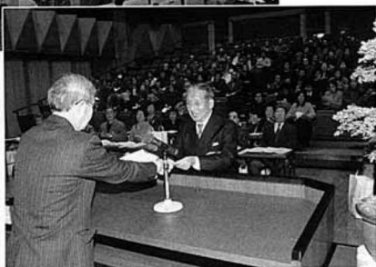
安藤政治学級委員長より賞状 を授与される受賞者