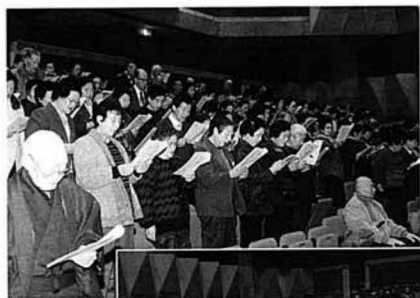
阿津賀志学級の歌を斉唱する 学級生