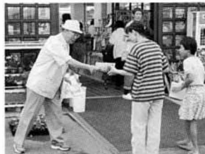
9月1日の知事選棄権防止街頭啓発活動

街頭にて棄権防止を呼びかける、町選挙管理委員と婦人会のみなさん。 加を目指すためさまざまな啓発活動を実施しています。十一月十二日に執行される国見町長選挙は、二十一世紀への国見町の代表を選ぶ大切な選挙となります。棄権することなく投票しましょう。