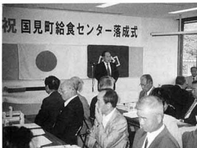
祝 国見町給食センター落成式

国見町土木建設業協会のみなさん約40名が8月25日、道路をきれいにと清掃作業を行いました。勝田病院から広域農道に通じる町道や阿津賀志山の裾野を巡る道など、延長約2Kmにわたり、土砂の除去や草刈を行いました。重機や草刈機を使い手際よく作業を進めます。約4時間の作業の結果、道はすっかり様変わり、きれいで走りやすい道路になりました。