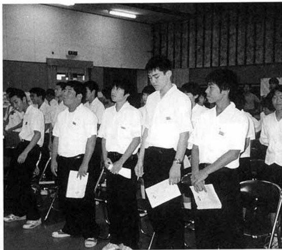
国見中との交流会にのぞむ、県北中の交流団員

県北中学校の生徒十三名は、八月一日から四日までの三泊四日の日程で、同じ町名により交流が行われている大分県東国東郡国見町を訪問しました。大分県国見中学校の生徒との交流や海洋スポーツを体験したほか、ホームステイにより家族とのふれあいや親交を深め、両町の関係を更なるものとなりました。