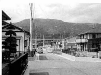
新しい家が建ち並びはじめるニュータウン

現在83区画を分譲しており、先着順に要望区画が選択できます。定住化促進事業など有利な特典もあり、将来、子供さんなどのためにも購入できます。この機会に是非お申込ください。